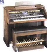
ローランド・ オルガン ミュージック・ アトリエ AT-900