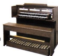
ローランド クラシック・ オルガン C-380